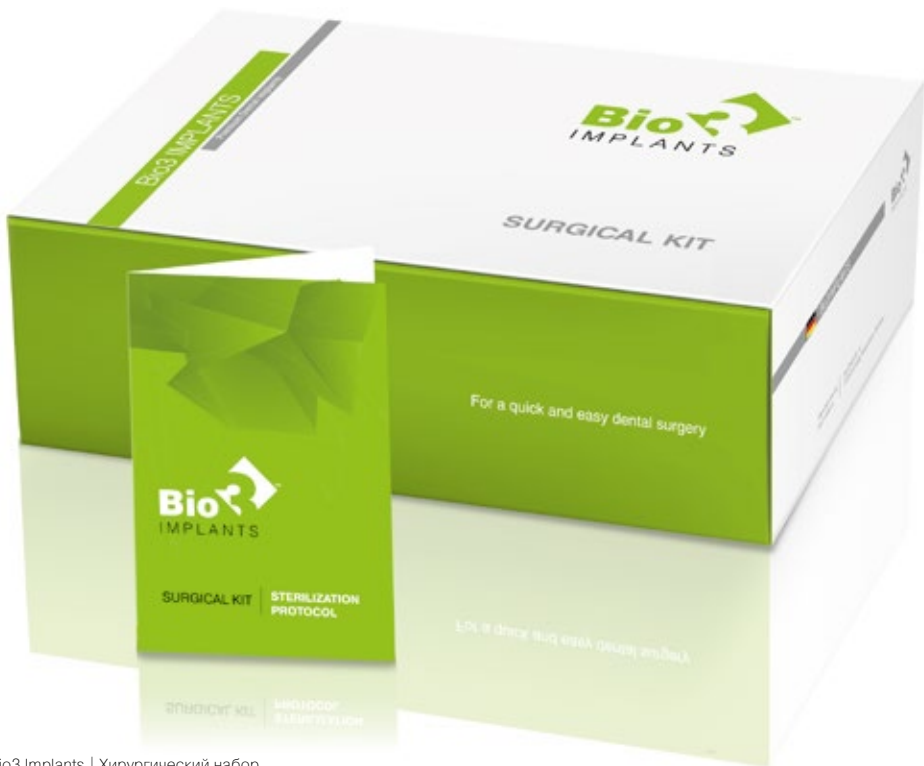
Bio3 Implants | Хирургический набор